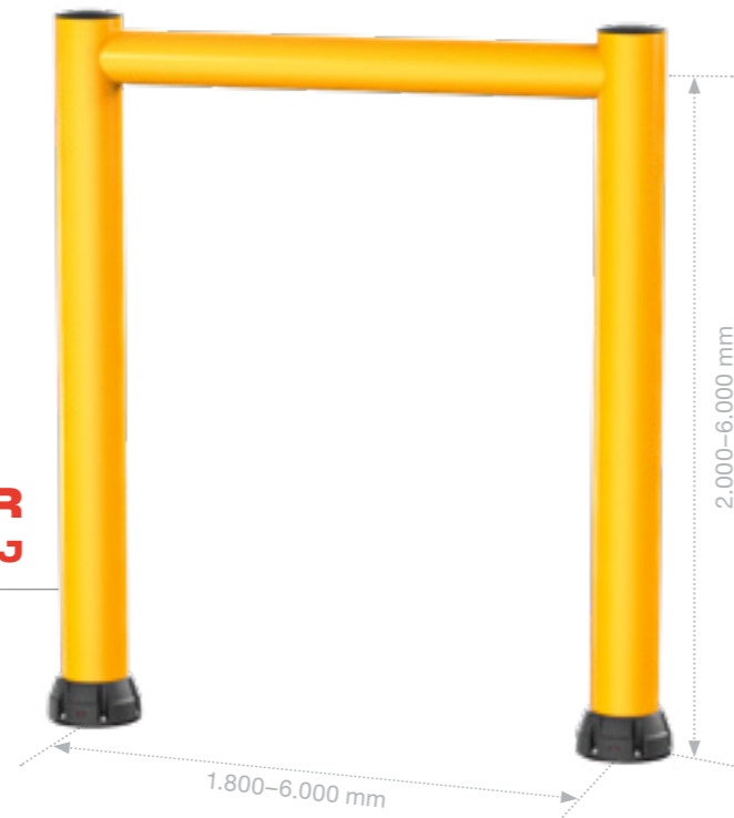
GP GOAL POST 250R 10,2 kJ