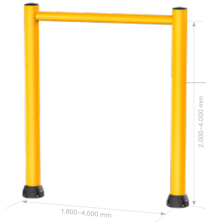
GP GOAL POST 200B 7,5 kJ