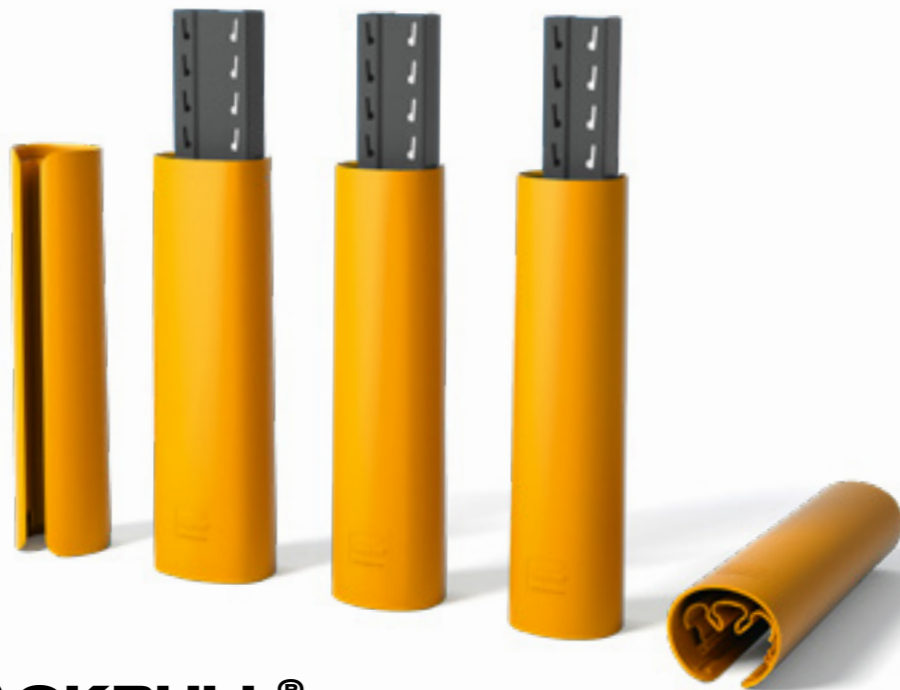
RACKBULL® »»» 400 J

Gabelstaplerkollisionen mit Regalen gehören zu den häufigsten Arbeitsunfällen in Lagerumgebungen. Arbeitskräfte stehen oft unter Zeitdruck, wenn sie mit Gabelstaplern, Hubwägen oder Staplern auf engem Raum zwischen Regalen manövrieren. Dies kann zu Kollisionen und Beschädigungen führen. Die Folgen können schwerwiegend sein, von geringfügigen Sachschäden bis hin zu eingestürzten Regalen. Beugen Sie Unfällen vor und schützen Sie Ihre Regale mit Regalschutzlösungen von Boplan.