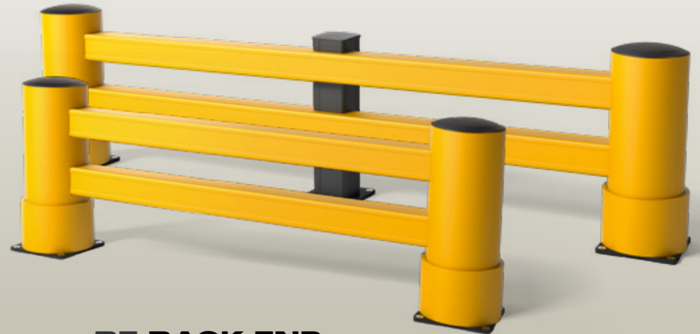
RE RACK END »»» 8,5 kJ

Unser Regalschutz besteht aus einem hoch energieabsorbierenden und flexiblen Material. Nach einer Kollision nimmt der Regalschutz wieder seine ursprüngliche Form an und behält sein Erscheinungsbild sowie seine Eigenschaften bei, sodass Ihr Regal intakt bleibt.