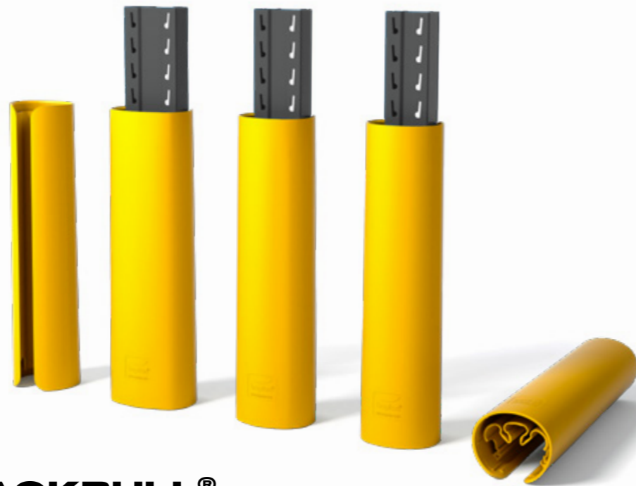
RACKBULL® >>> 400 J

Vorkheftrucks die stellingen aanrijden behoren tot de meest voorkomende arbeidsongevallen in magazijnen. Werknemers staan onder grote tijdsdruk en manoeuvreren in de krappe ruimte tussen de stellingen met vorkheftrucks, pallettrucks of stapelaars. Dat leidt tot aanrijdingen en schade. De gevolgen zijn ernstig: van kleine materiële schade tot ingestorte stellingen. Voorkom ongevallen en bescherm je stapelrekken met de rekbeschermers van Boplan.